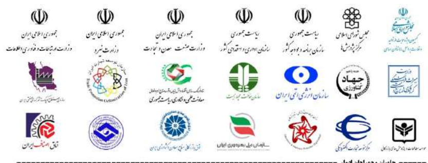
حامیان و همراهمان افوار