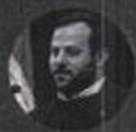
Mahdi Zeighami Deputy Minister of Industry, Mine, Trade & President of Iran Trade Promotion Organization, I.R. of Iran