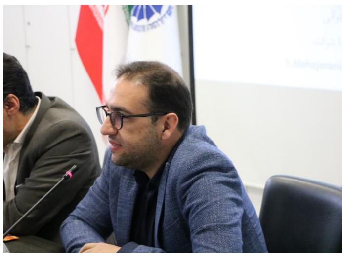
آشنایی با پنل های خورشیدی شرکت مانا انرژی پاک