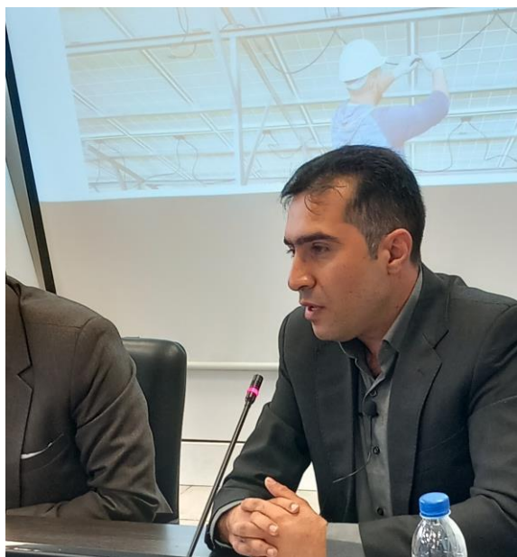
آشنایی با کابل سولار شرکت سیم و کابل یزد