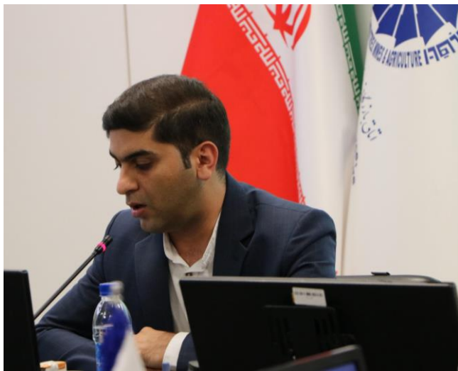
مهندس کهنوجی کارشناس مسئول بازار برق بورس انرژی ایران