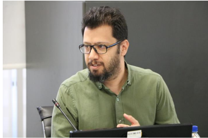
آشنایی با مبانی انرژی های تجدیدپذیر (خورشیدی)