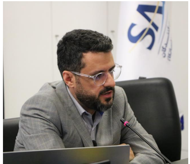
مهندس ناطقی نماینده ساتبا توضیح تامین مالی