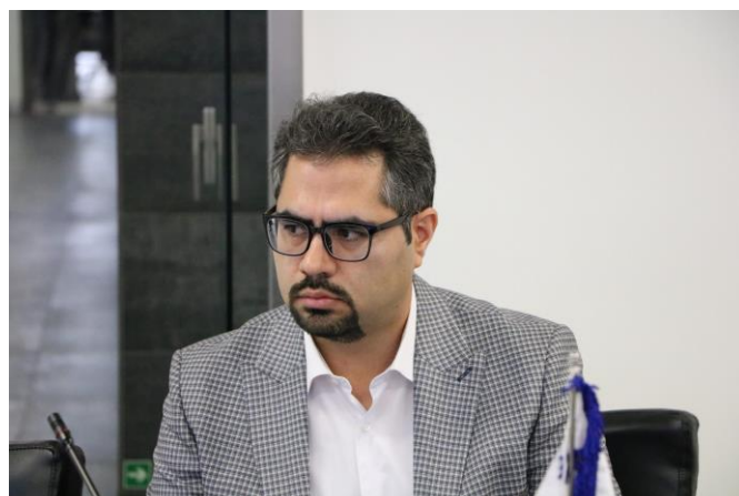
آشنایی با مانیتورینگ نیروگاه های خورشیدی شرکت الماس الکترونیک سپاهان