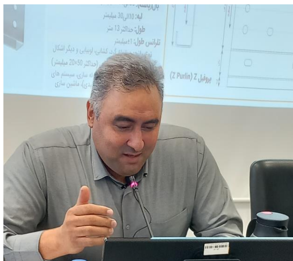
آشنایی با سازه های نیروگاه خورشیدی شرکت سریر صنعت امیر