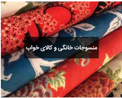
منسوجات خانگی و کلاهی خواب

خریداران این لوازم و خدمات از سراسر منطقه به دنبال جدیدترین محصولات، طرح‌ها و راهکارها هستند؛ بنابراین بهتر است این فرصت را از دست نداده و به نیاز آن‌ها پاسخ دهید.