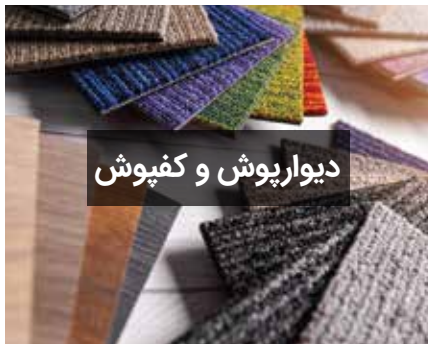
دیوارپوش و کفپوش