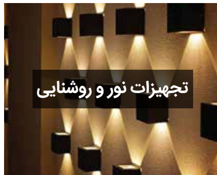
تجهیزات نور و روشنایی