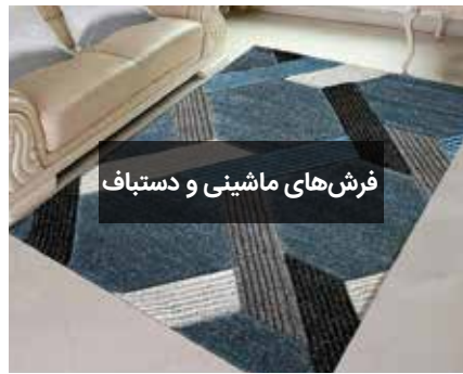
فرش‌های ماشینی و دستباف