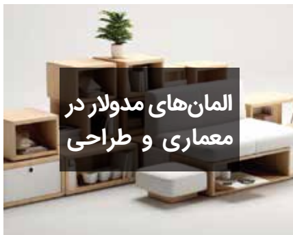
المان‌های مدولار در معماری و طراحی