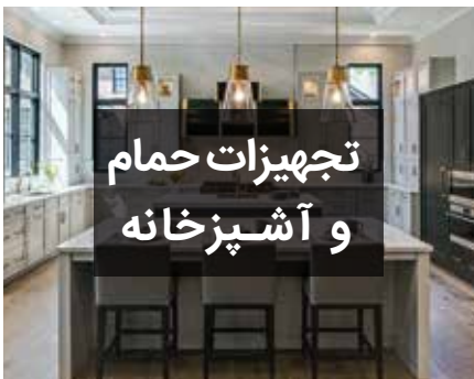
تجهیزات حمام و آشپزخانه