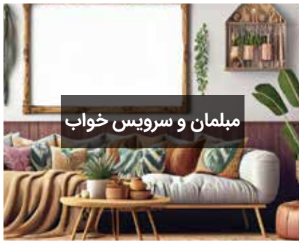
مبلمان و سرویس خواب