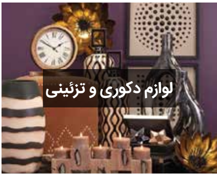
لوازم دکوری و تزئینی