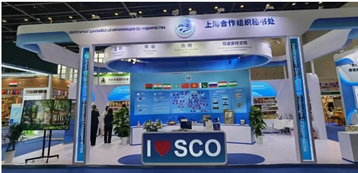
غرفه سازمان همکاری شانگهای در CAEXPO 2024

با توجه به روابط نزدیک سازمان همکاری شانگهای و انجمن آسه‌آن، دبیرخانه آن سازمان برای اولین بار به طور رسمی برای برپایی غرفه در این دوره نمایشگاه ASEAN-CHINA، دعوت شد و حضور یافت. غرفه سازمان، به وسعت حدود ۶۰ متر، محصولاتی از کشورهای عضو را به نمایش گذاشت. معرفی سازمان همکاری شانگهای در یک پوستر بزرگ شامل پرچم کشورهای عضو (شامل ج.ا.ایران) و چند بروشور انجام شده بود. دبیرکل سازمان همکاری شانگهای، آقای Zhang Ming در روز اول از نمایشگاه بازدید کرد.