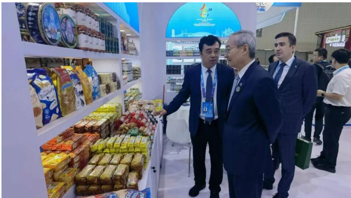
دبیرکل سازمان همکاری شانگهای در حال بازدید از غرفه سازمان